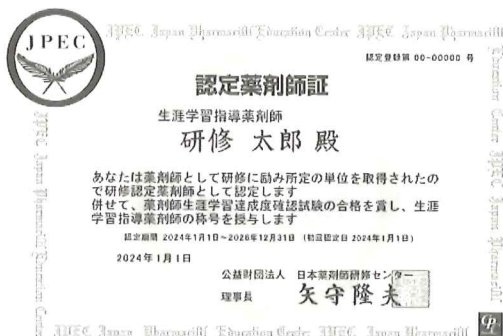
(生涯学習指導薬剤師の認定薬剤師証)